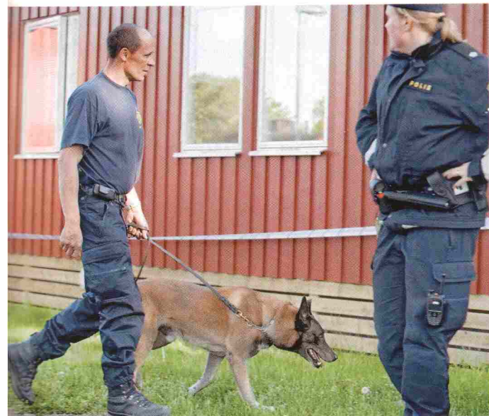
ZZIA. Bombhundar från Malmö sökte igenom en barack där två män, stänkta för hot mot ett kärnkraftverk i maj, bodde.